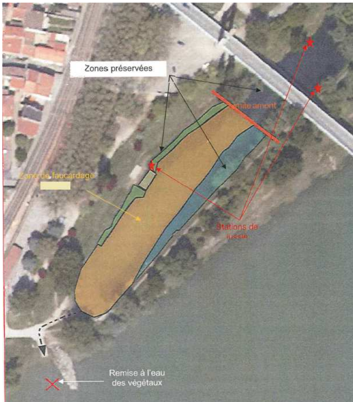
Figure n°1 : Localisation des zones à faucarder, des zones à préserver et des stations de Jussie.