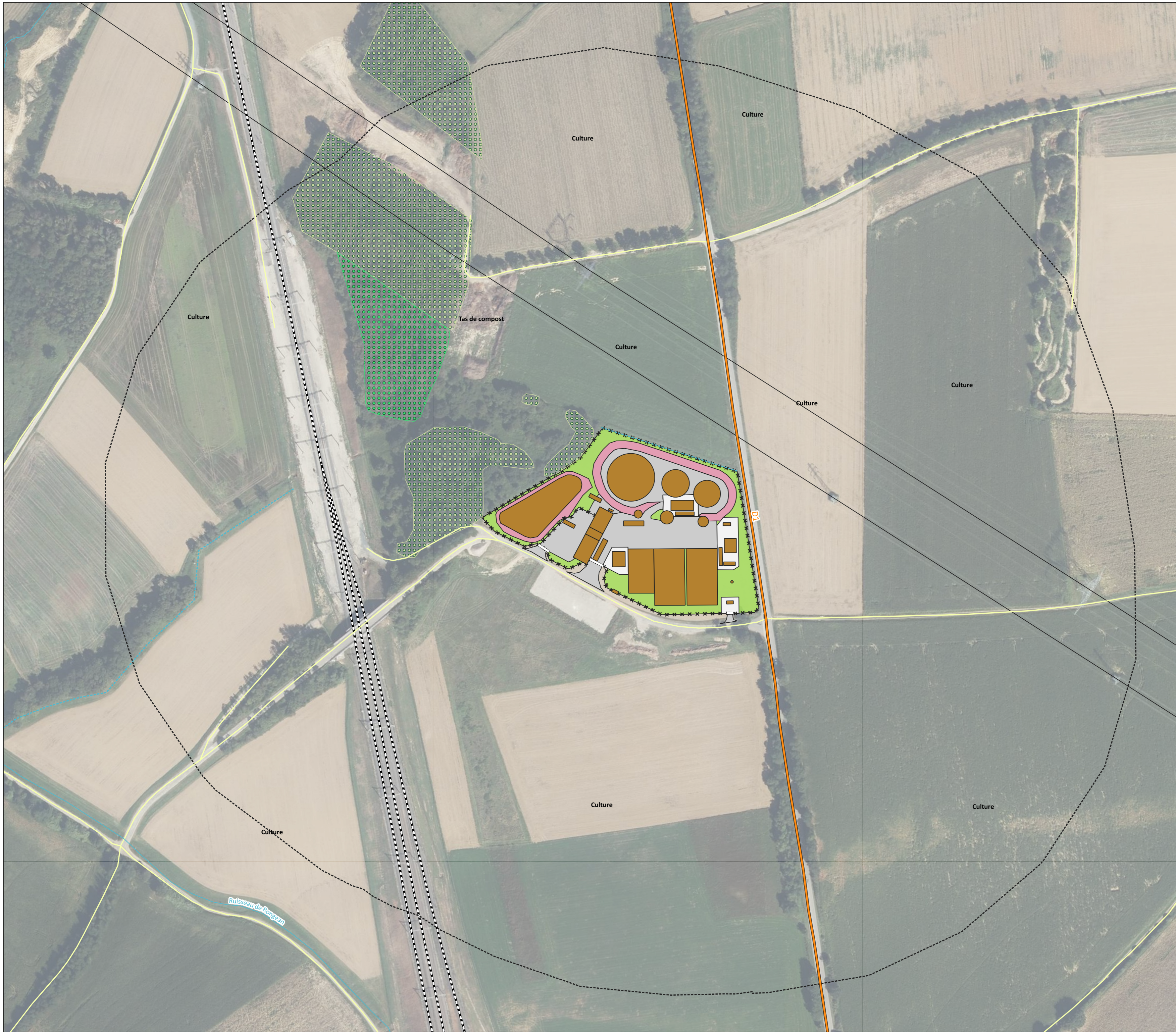
Illustration 14 : Plan des abords